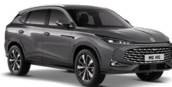
HAMPSTED siva 500,00 €