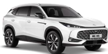
PEARL bijela Bez naknade