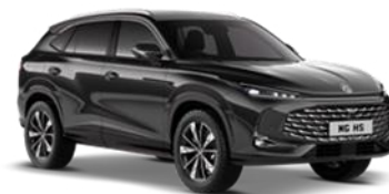
PEBBLE crna 500,00 €