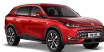
DIAMOND crvena 500,00 €