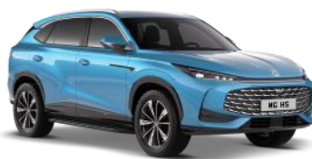
ARCTIC plava 500,00 €